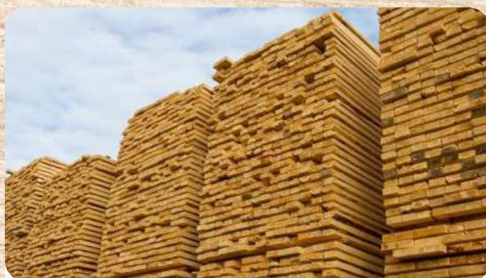
یکی از بزرگترین شرکت های تامین کننده چوب ( ساسنا، بولکا، بریوزا، آسنا و کدرا )