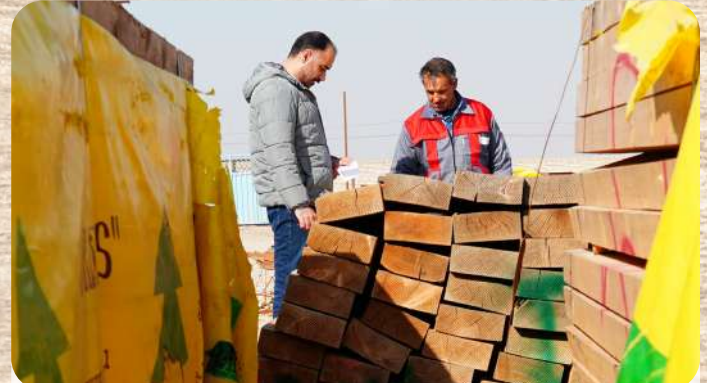
مشاوره نیروهای متخصص جهت خریدی مناسب و مطمئن