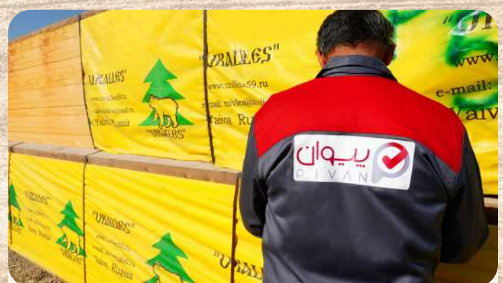
کنترل کیفیت محصولات با حضور کارشناسان ( QC )