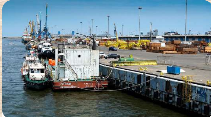
امکان تهیه محصول مورد نظر با قیمتی مناسب در کوتاه ترین زمان