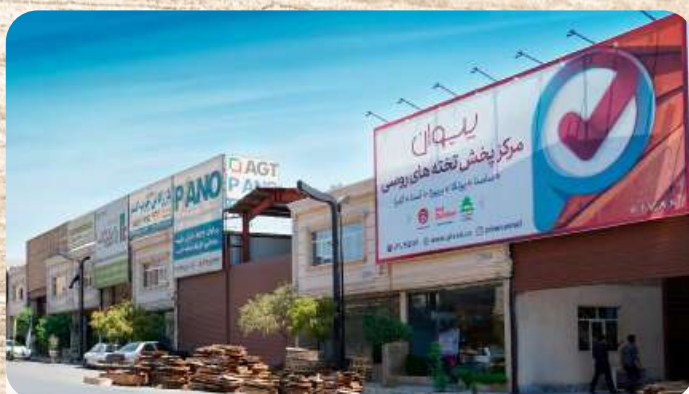
در اختیار داشتن مرکز پخش تخته های نراد در سایت خاوران