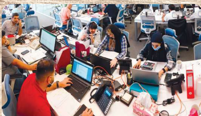
ایجاد سازمانی منظم و قوی جهت افزایش سرعت و دقت در کار