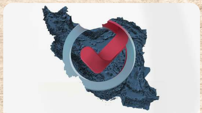
فعالیت در سرتاسر کشور با نیم قرن تجربه