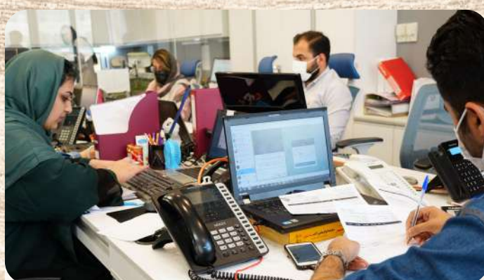
ارائه خدمات ویژه پس از فروش جهت ایجاد رضایتمندی بیشتر